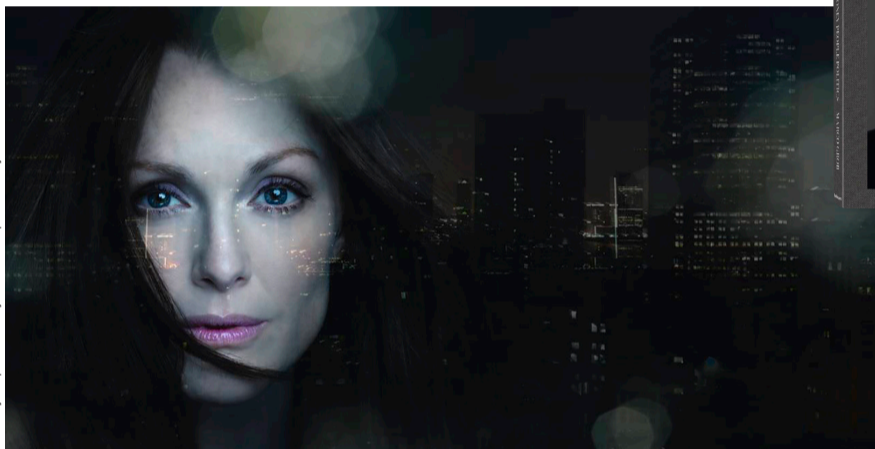
© Money People Politics by Marco Grob, published by teNeues