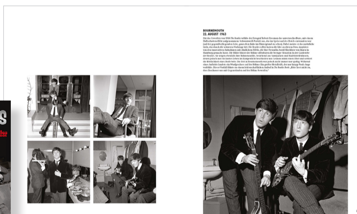
© »The Beatles«, Heel Verlag, Königswinter, 2016